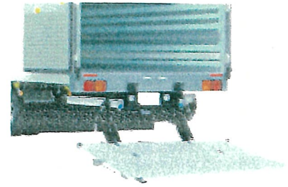
床下格納式テールゲートリフター