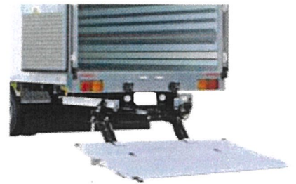
床下格納式テールゲートリフター