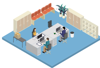
企業(事務部門)のお客様