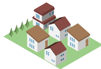
集合供給のお客様