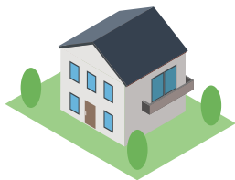
一般家庭のお客様

※工場など生産現場での高圧ガス保安法上の消費者、国及び地方公共団体は対象外となります。 ※大口(1月当たり50㎡以上)契約は対象外となります。